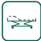
FUSSTEIL 0 - 30°